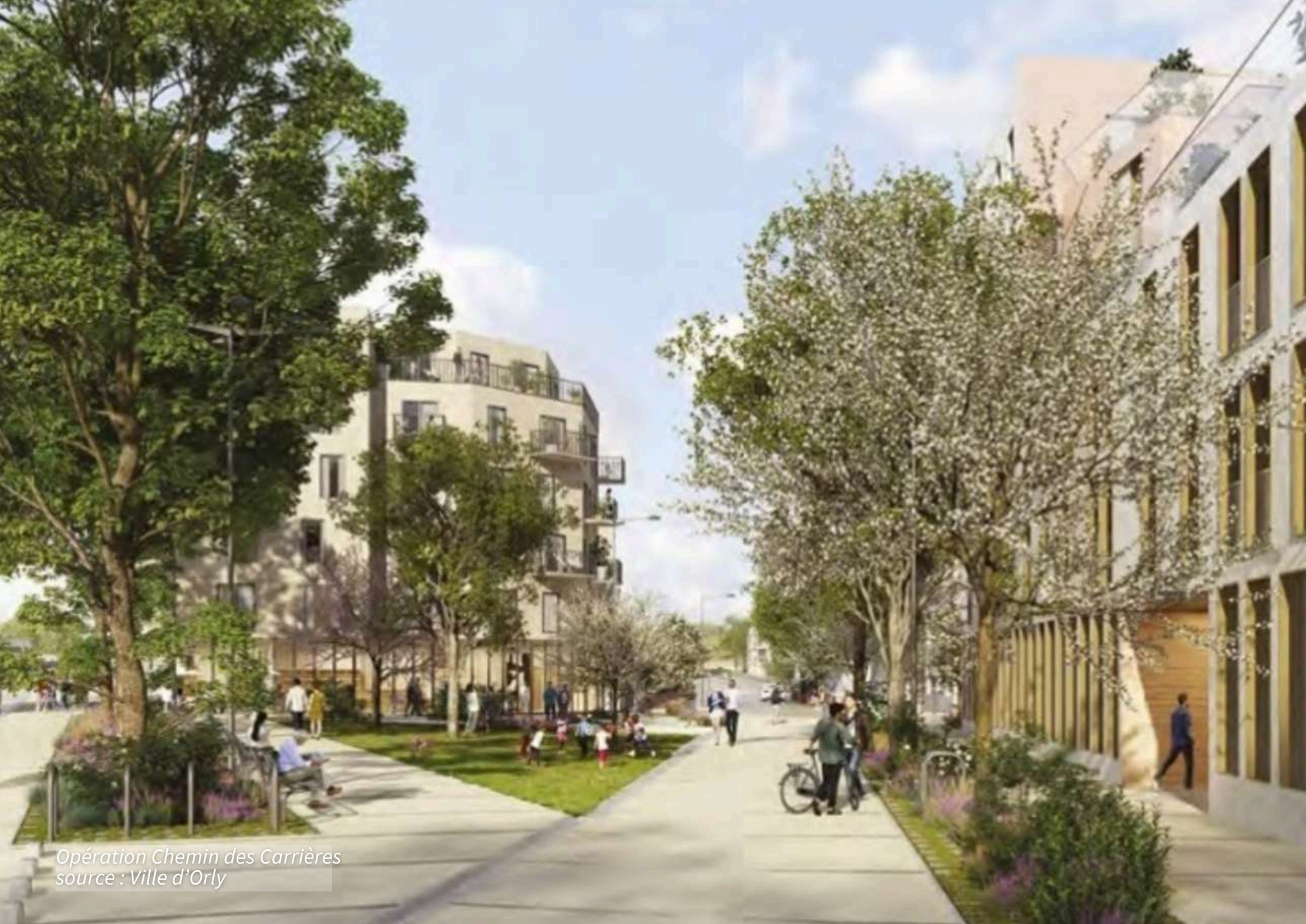
Opération Chemin des Carrières