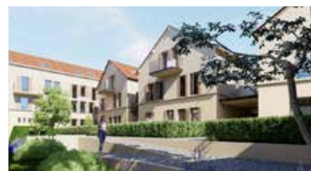
Et le cœur d'îlot.