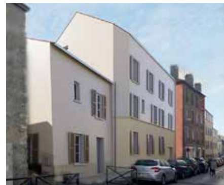
Le même endroit une fois les travaux achevés.