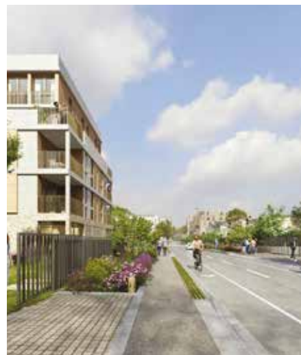
Une partie du Chemin des Carrières réaménagé début 2025.