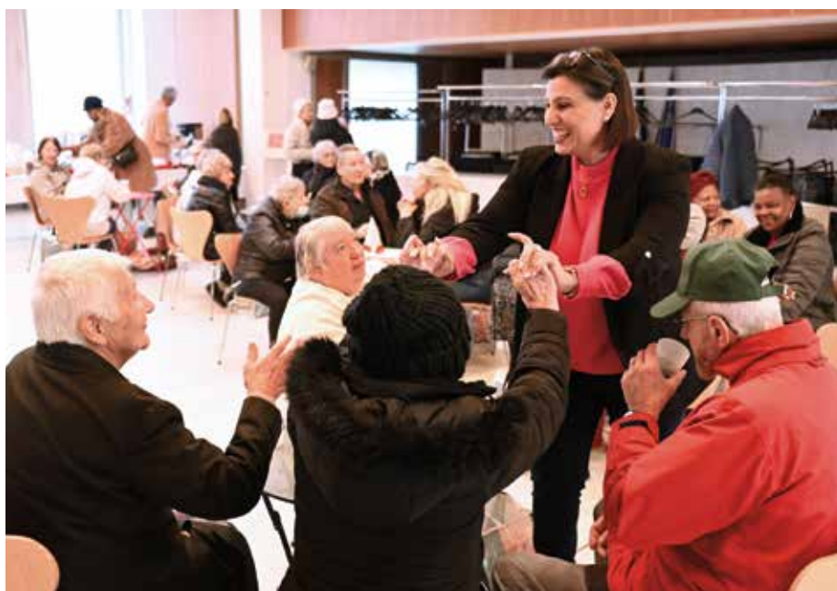
La maire lors de la distribution des colis aux seniors, le 4 décembre 2024.

Maire d'Orly, Conseillère départementale