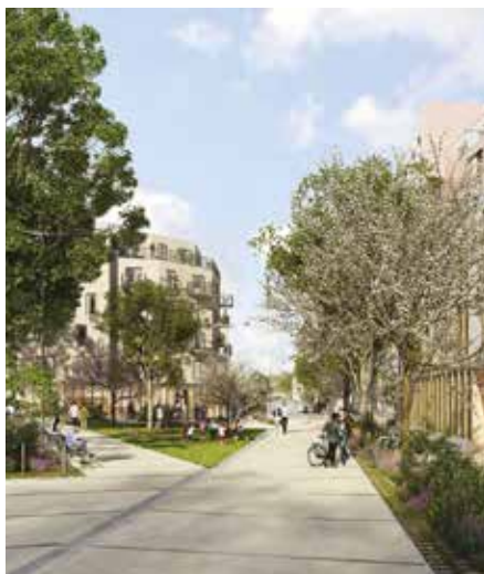
La future place de Longboyau.

L'ouverture au public de ces espaces publics est prévue à l'été 2025. ■