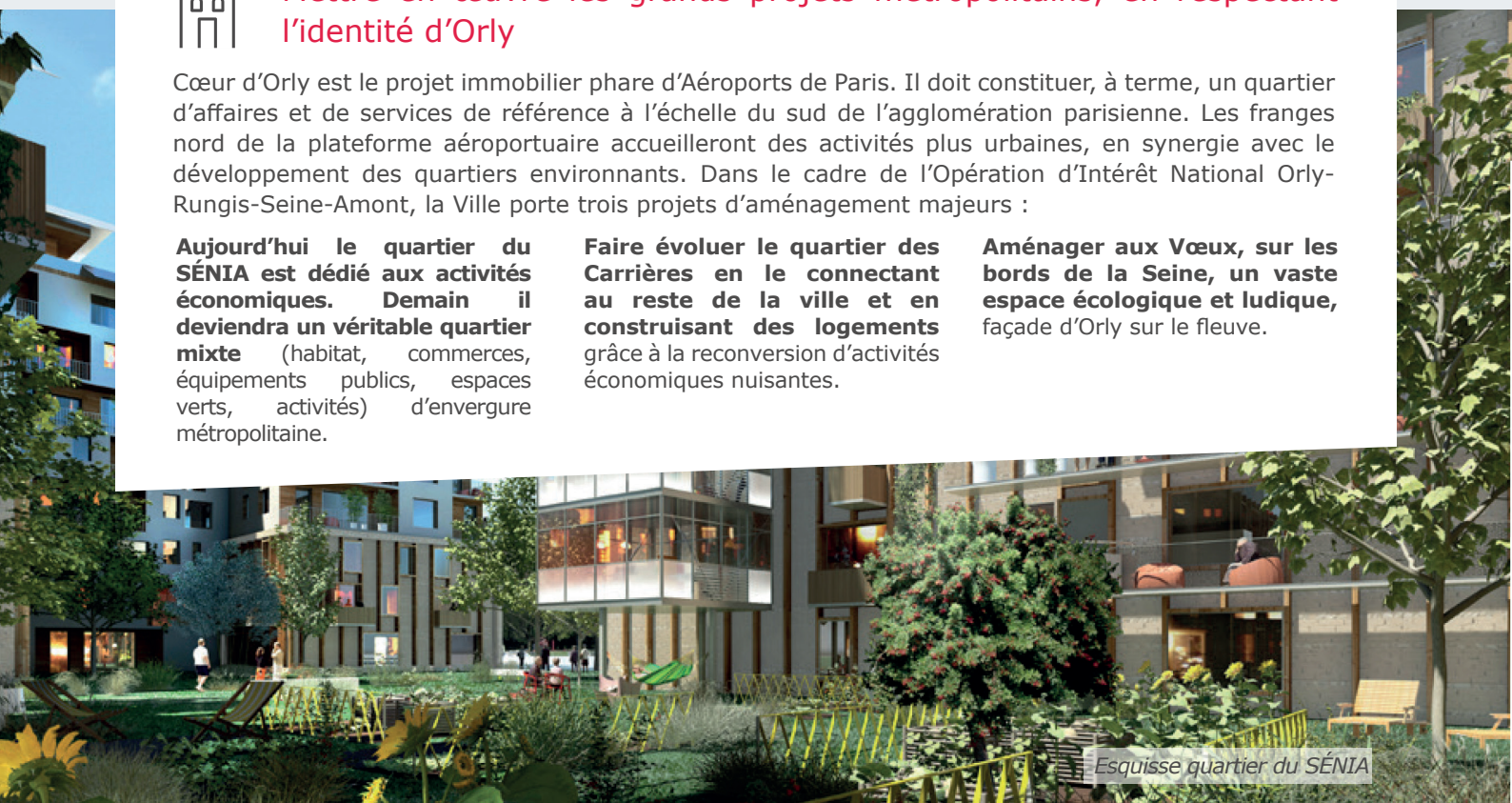
Esquisse quartier du SÉNIA

Aménager aux Vœux, sur les bords de la Seine, un vaste espace écologique et ludique, façade d'Orly sur le fleuve.